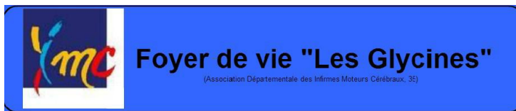
Foyer "Les Glycines" – Pipriac (35)