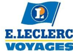
Agence de St Nicolas de Redon (44)