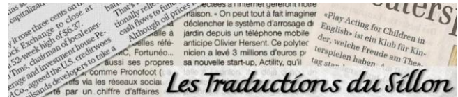
“Les Traductions du Sillon” – Savenay (44)