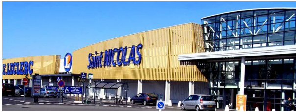
E.Leclerc - St Nicolas de Redon (44)