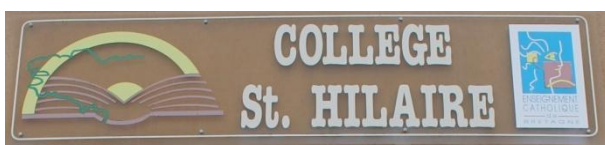
Collège St Hilaire – Allaire (56)